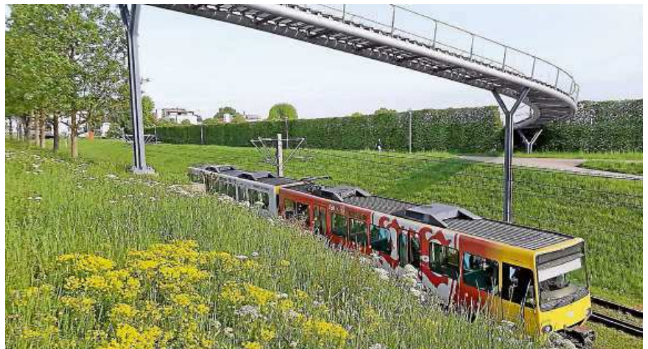
Auch die Stadt Ostfildern beteiligt sich an der Kampagne „Mähfreier Mai“.

► Weitere Informationen zur Kampagne finden Interessierte auf der Homepage der Deutschen Gartenbau-Gesellschaft 1822 e.V. unter www.dgg1822.de .