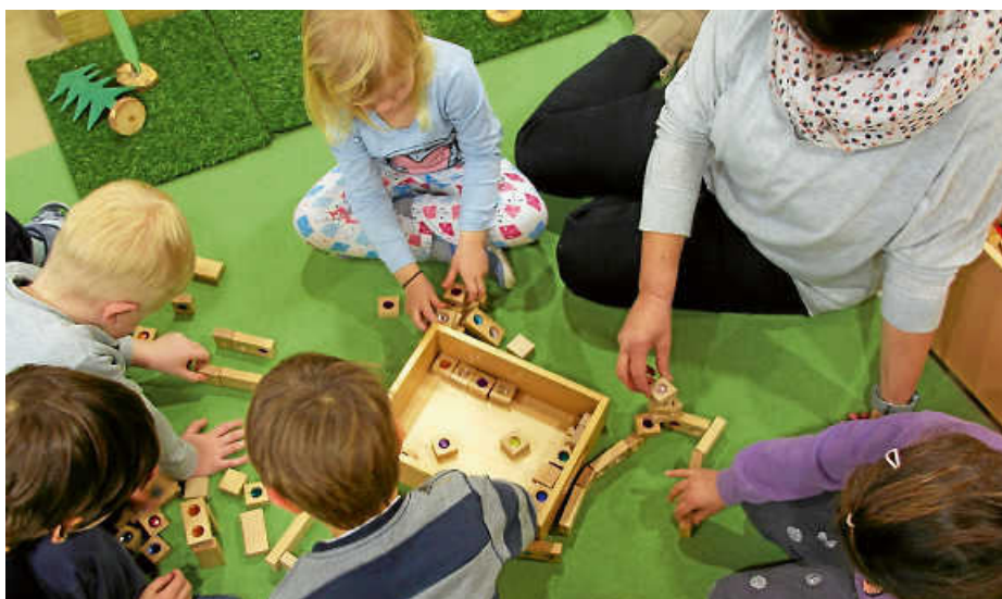
Eine Erzieherin fördert die Kreativität der Kinder mit Bauklötzen.

Insgesamt ist es wichtig, dass alle Beteiligten – Eltern, pädagogisches Fachpersonal und kommunale Einrichtungen – gemeinsam daran arbeiten, die Herausforderungen im Bereich der Kinderbetreuung zu bewältigen. Durch gegenseitiges Verständnis und Unterstützung kann eine bessere Betreuung für die Kinder gewährleistet werden. eis