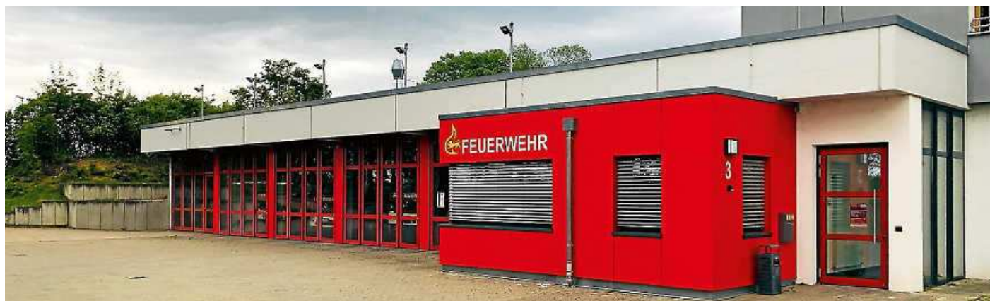
Das heutige Gebäude der Freiwilligen Feuerwehr in Nellingen ist bereits der dritte Standort.

► Weitere Informationen unter www.ff-ostfildern.de/fire-festival