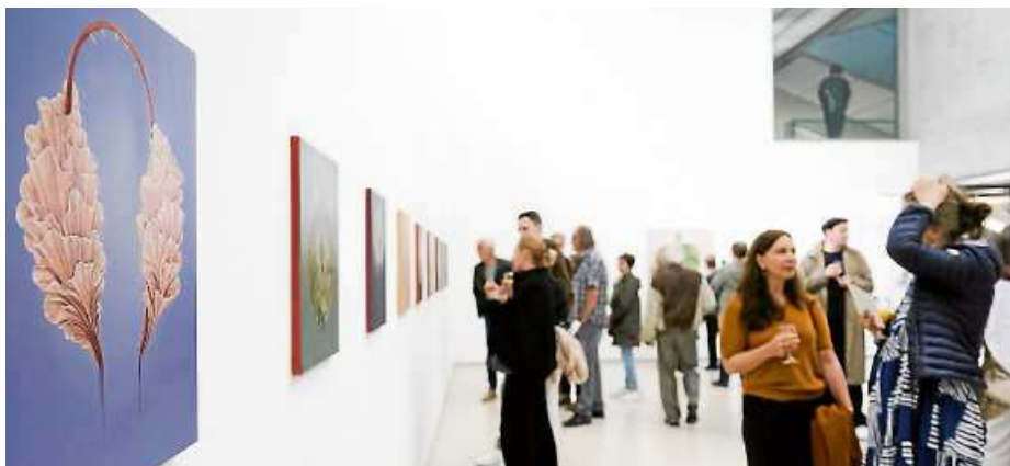
Vernissage der Ausstellung „Ceres“.